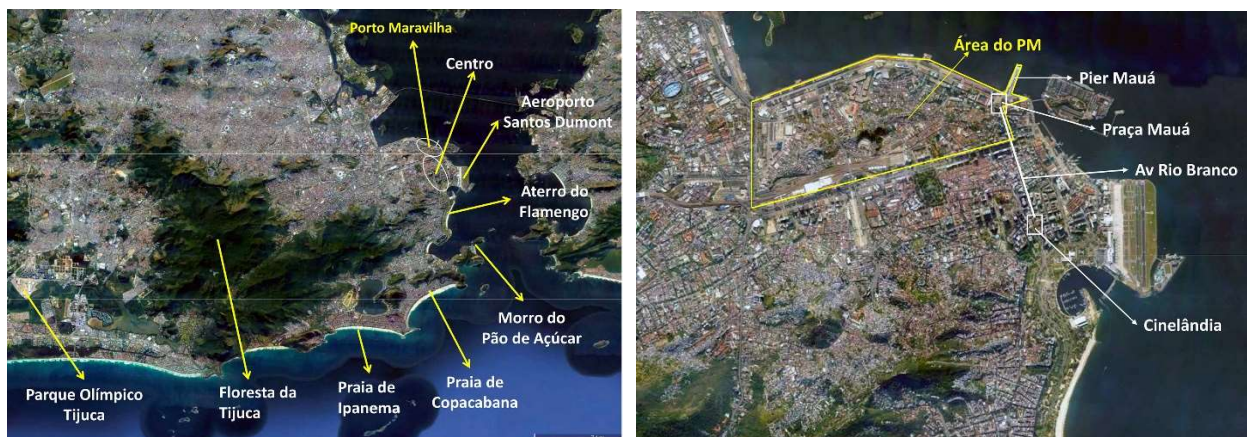
Localização do Porto Maravilha na cidade / Área do PM em relação ao centro do Rio. Anotações sobre base Google Earth

O que prevaleceu do instrumento foram os Certificados de Potencial Adicional de Construção (CEPAC), papéis negociáveis de potencial construtivo na área, o que em si certamente não produz GPU por que não produz projeto urbano, apesar de impactar profundamente a morfologia pelo adensamento e a verticalização. Em relação à área urbana afetada, o instrumento prevê a definição do perímetro da operação, na lógica dos CEPAC e para inflar os negócios, eles são superdimensionados, dificultando a relação entre projeto urbano e superestrutura. A intervenção Porto Maravilha é uma OUC, portanto sofre das patologias inerentes ao instrumento legal, porém os enunciados e a materialização desta operação são muito diferentes dos efetivados nas demais OUC pelo país.