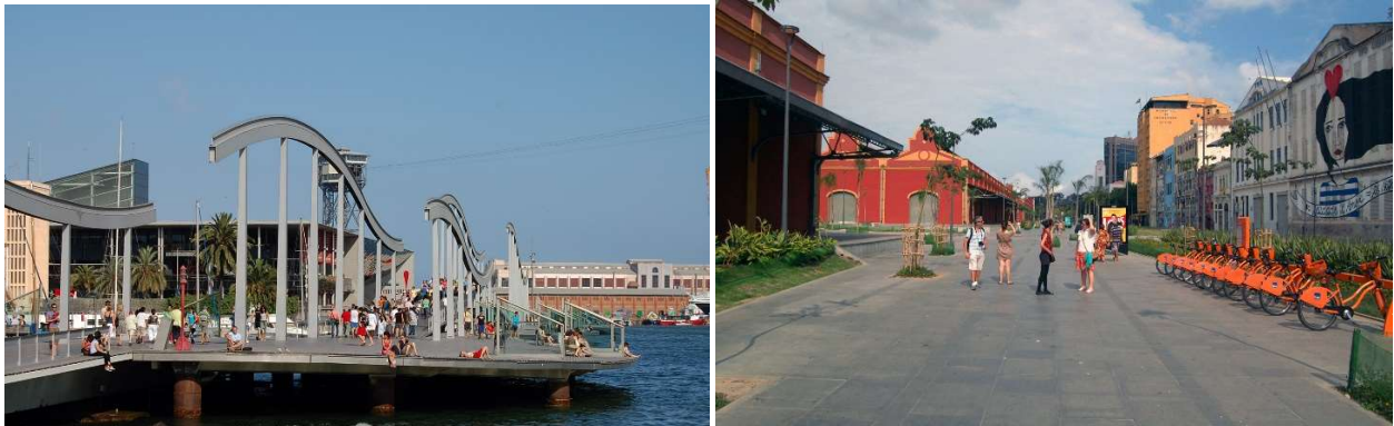
Port Vell, Barcelona / Porto Maravilha, galpões portuários reciclados mas com pouco uso.

Barcelona. Tanto lá quanto aqui, as intervenções portuárias são expressões contundentes, pelo porte e arranjo cenográfico, dos discursos urbanísticos colocados nas intervenções de final de século, lá concentrados no espaço público e na cidade compacta, aqui nas pessoas que “interessam”. Se a perversidade do projeto para as Olimpíadas está em se direcionar à população já bastante privilegiada, no Porto ela adquire maior profundidade na medida em que disponibiliza investimentos e lugar de vida de comunidades para o consumo das mesmas pessoas que “interessam”.