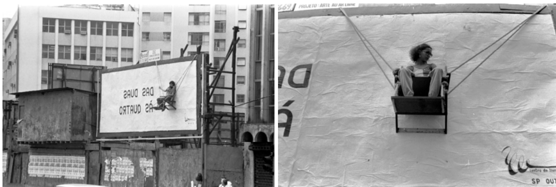
Figs 14 e 15: Out-door do VsP (+CLE) no Projeto Ao Ar Livre, 1980.

A intervenção urbana não. Ela é o resultado da leitura e das vivências do grupo com o espaço da cidade alvo da ação, ela define sua formatividade a partir dos propósitos da ação sobre o espaço. Existe um programa para a intervenção e ele, com frequência, atua muito mais nos resultados formais do que as pesquisas de ateliê desenvolvida pelo grupo. O programa da intervenção, também, reforça a ideia de trabalho coletivos pois aplaina as opções estéticas individuais e reforça a tomada de decisões estratégicas. A elaboração do programa é resultado da experimentação do território, sua vibração e fluxos, não é uma questão puramente espacial, dimensional. Trata-se do entendimento de cidade e das formas de vivenciá-la experimentada pelos grupos. Na mesma medida é a territorialização da intervenção, ou em que condições o território reage a ela. Isso deve ser considerado em duas instâncias: 1. a intervenção produz território na medida em que insere novos códigos sobre ele, se reterritorializa (Deleuze e Guattari 1997, 115/118); 2. os códigos do território atravessam a intervenção realizada, tanto em relação à aceitação do público, quanto às relações com os signos do lugar.