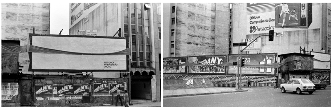
Figs 12 e 13: Out-door do 3N3 no Projeto Ao Ar Livre, 1980.

A intervenção urbana opera no fragmento um corte abrupto na estrutura da cidade, , podemos dizer que ao intervir em uma rua da cidade, a ambição é intervir no sistema urbano. Alguns grafites entendem perfeitamente a relação de escala observador / superfície / cidade. Para a intervenção urbana , o entendimento do sítio é sempre em escala urbana.