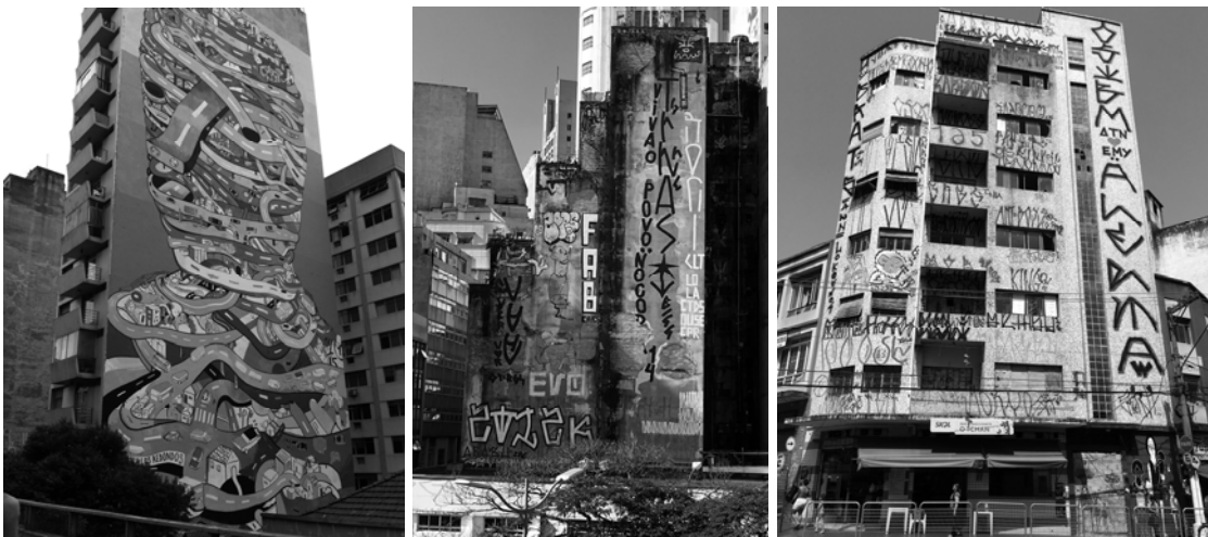
Fig 3: Grafite em SP. Figs 4 e 5: Pixo em SP.

No início da década de 1980 esta nova condição de cultura urbana era evidente no Centro de São Paulo. Em meio ao processo de abandono e decadência física do centro antigo, tribos de diferentes origens e opções político-culturais passaram a frequentá-lo com códigos específicos para se comportar, vestir, se agrupar.