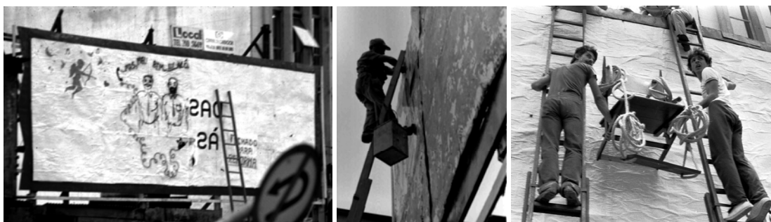
Figs 9, 10 e 11: Projeto Ao Ar Livre durante montagem dos out-doors, 1980.