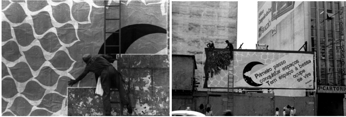
Figs 16 e 17: Out-door do MR no Projeto Ao Ar Livre, 1980.