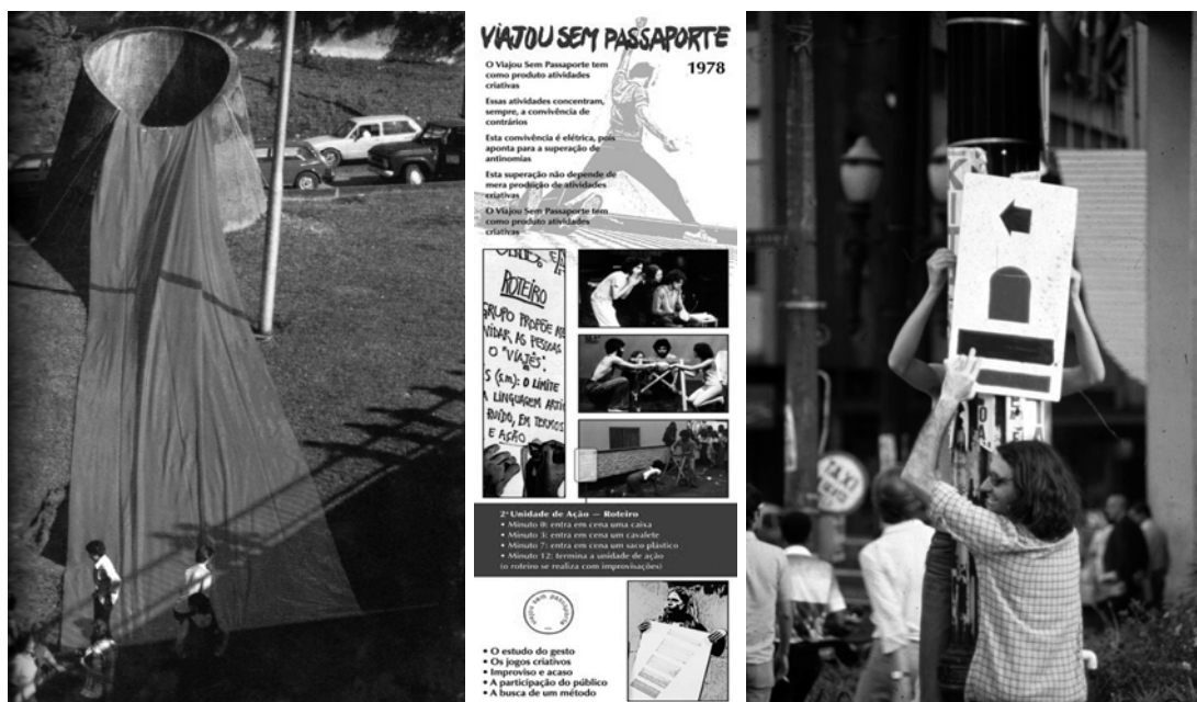
Fig 6: 3N3 em ação, 1979 (Acervo do grupo). Fig 7: Roteiro de ação do VsP (Acervo do grupo). Fig 8: MR em ação, 1980 (Foto J. Bassani)

Com relação a este terceiro ponto deve-se acrescentar que os grupos caracterizavam-se por definições em duas instâncias, a primeira circunscrita na necessidade de se movimentarem nas condições que lhes eram dadas, não só pela situação política do país, mas, também pelas limitações físicas para exercerem seus desejos de manifestação. A segunda, ao se definir uma estratégia para ação desejada, era necessário um plano para viabilizá-las, ou seja, o grupo é uma condição tática de equilíbrio, para enfrentar grandes desafios, a começar pela elaboração do programa, plataforma de intervenção, o que não é fácil sozinho.