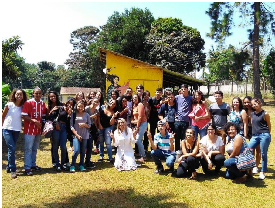
Encontro na última oficina, que reuniu alunos da USP, da E.E. Prof. Adrião Bernardes, agentes da UBS e da Casa Ecoativa, realizado na própria Casa Ecoativa.

Bernardes e o coletivo Casa Ecoativa. O caso da escola Adrião constitui-se como um canteiro experimental em práticas educativas que alia métodos formais e não formais de ensino, abrindo-se a diferentes iniciativas de agentes externos, como o coletivo. Foi neste contexto fértil em que o projeto de extensão universitária encontrou abertura para dar continuidade ao processo de territorialização com os estudantes e demais agentes envolvidos direta ou indiretamente. Dessa forma, os trabalhos realizados neste projeto não têm caráter somente extracurricular, mas fazem parte de uma proposta metodológica de educação e territorialização.