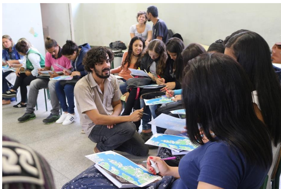
Oficinas realizadas no projeto Revisitando o território: novas percepções sobre o Grajaú , na E.E. Prof. Adrião Bernardes, Ilha do Bororé.