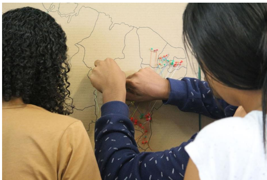
Produção de mapas durante as oficinas.