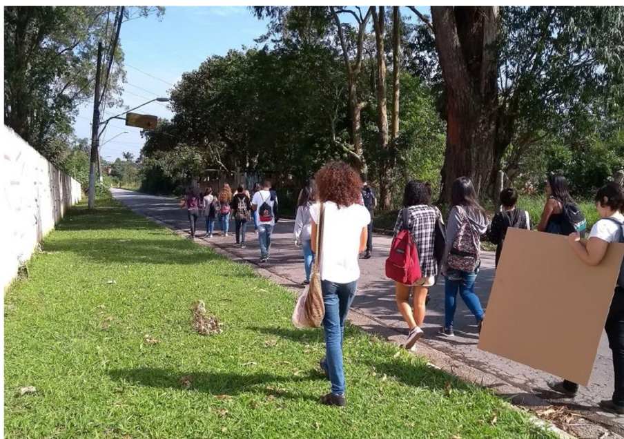
Território: Representações e derivas com os estudantes da USP e da E.E. Prof. Adrião Bernardes.

Também considerando estas dinâmicas e a nova pauta colocada por estas propostas, que propusemos para comunidade da Ilha do Bororé um trabalho conjunto sobre o seu território. A primeira pergunta que surge para definir bases para esta parceria universidade – comunidade: o que objetivamente é o “trabalho sobre o território” proposto?